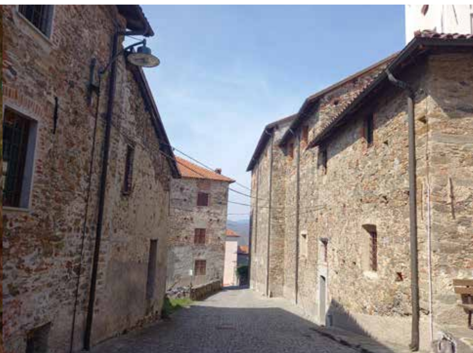
20 AGOSTO DEGO