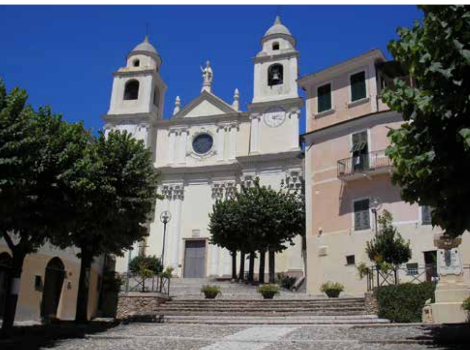
18 AGOSTO BORGIO VEREZZI