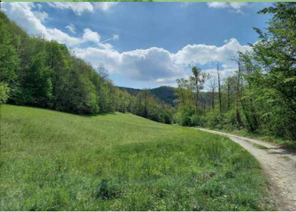
8 LUGLIO CENGIO