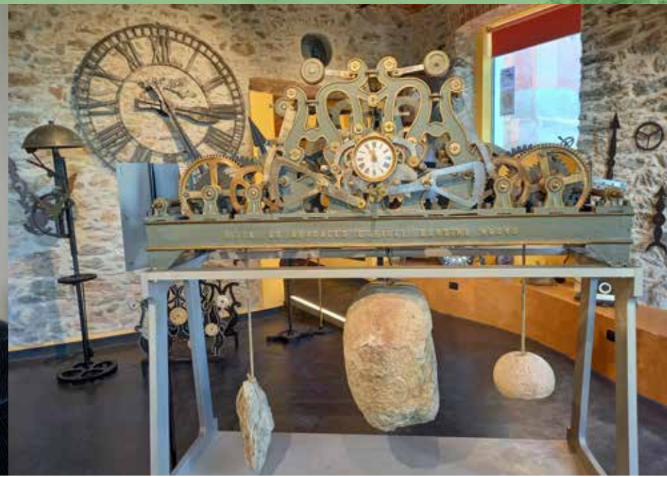
16 LUGLIO TOVO SAN GIACOMO